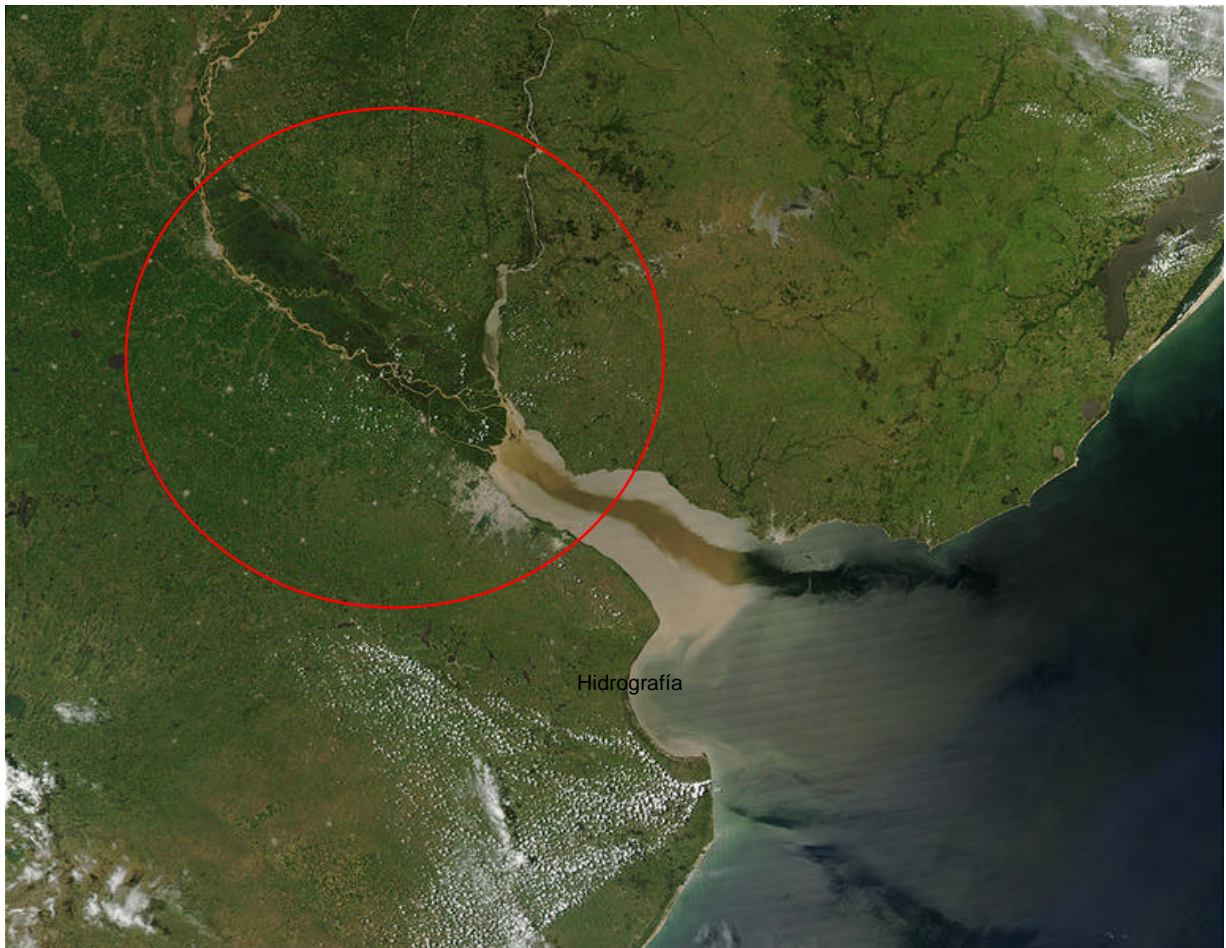
Imagen Satelitaria del Delta del Paraná

El río Bermejo aporta un 50% del material sólido al Paraná entre arenas y arcillas rojizas que representa aproximadamente 150 millones de toneladas de material sólido que bajan hasta el delta. Tiene un avance medio de 90 m por año (CFI 1962).