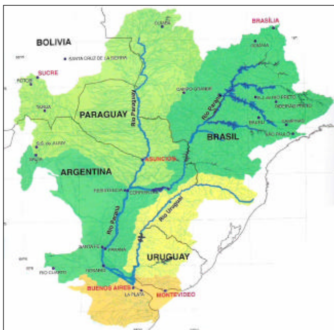
Cuenca del Plata