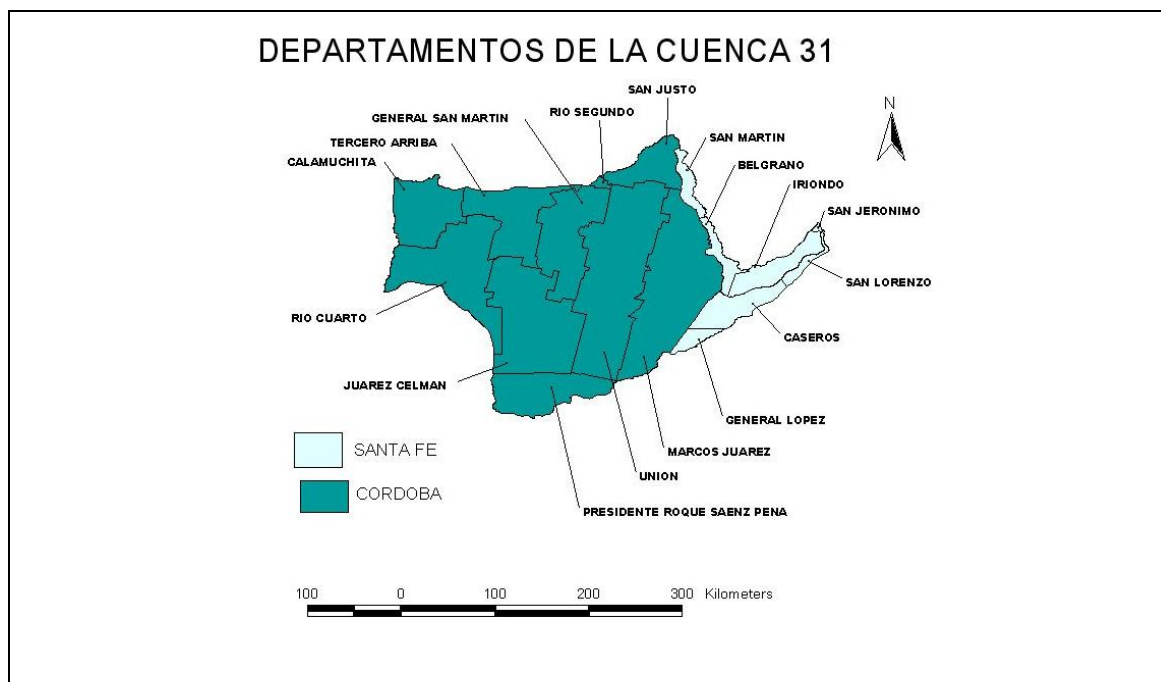
Elaboración propia en base a datos del censo 2001, INDEC y Atlas digital de los recursos hídricos superficiales de la República Argentina